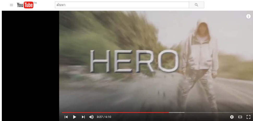
รูปที่ 1 หนังสั้นเทคนิคพิเศษเรื่อง ฮีโร่ บนเว็บไซต์ยูทูป